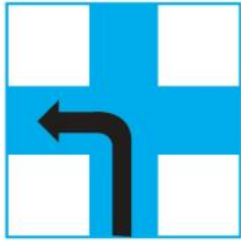
turn left 左轉