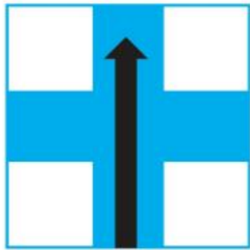
go straight 直走