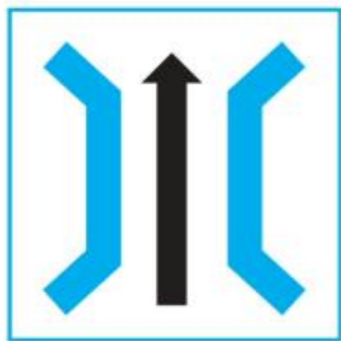
cross 1 the bridge 穿過橋